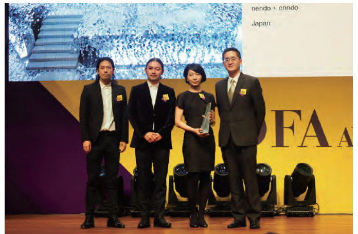
( 颁奖仪式②：onndo设计工作室成员上台领取奖杯 )