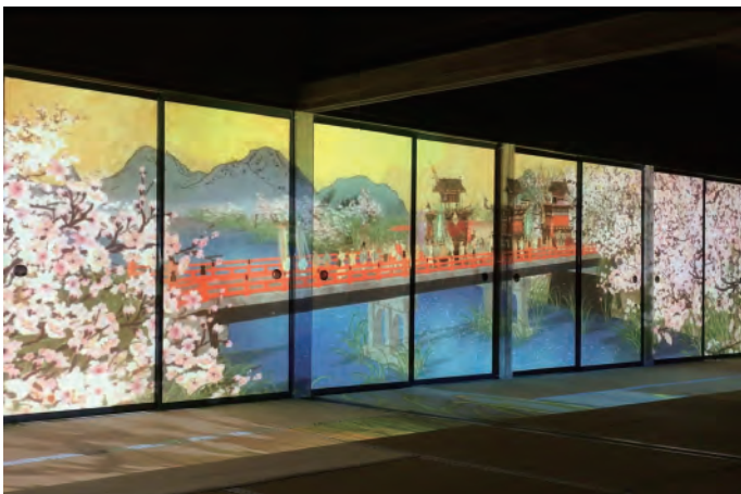
“高山阵屋 飞驮信用组合光雕投影”：银奖