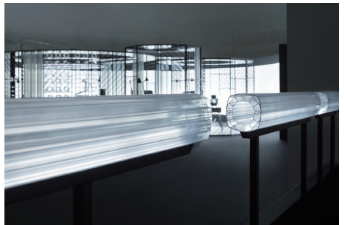
“Slice of time”：贡献奖