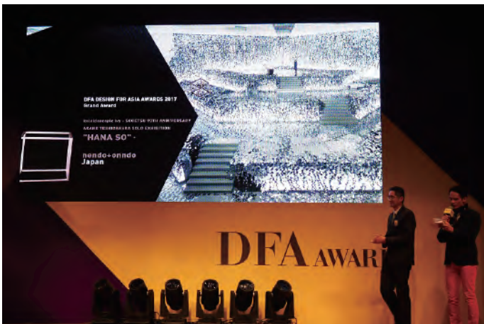
( 颁奖仪式①：大奖揭晓 )