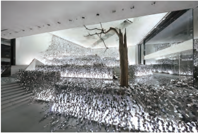
“草月90周年纪念 敕使河原茜个展 HANA SO”：大奖