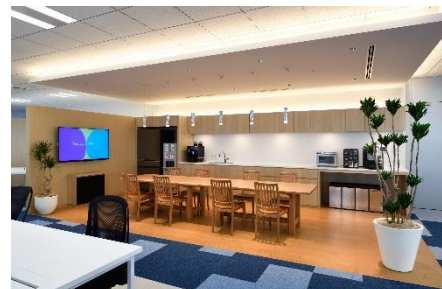
リフレッシュエリア(Honda イノベーションラボ Tokyo)