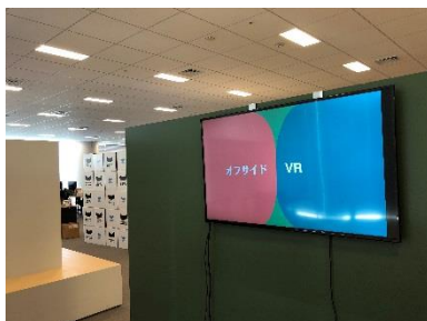
会議スペース(カヤック)